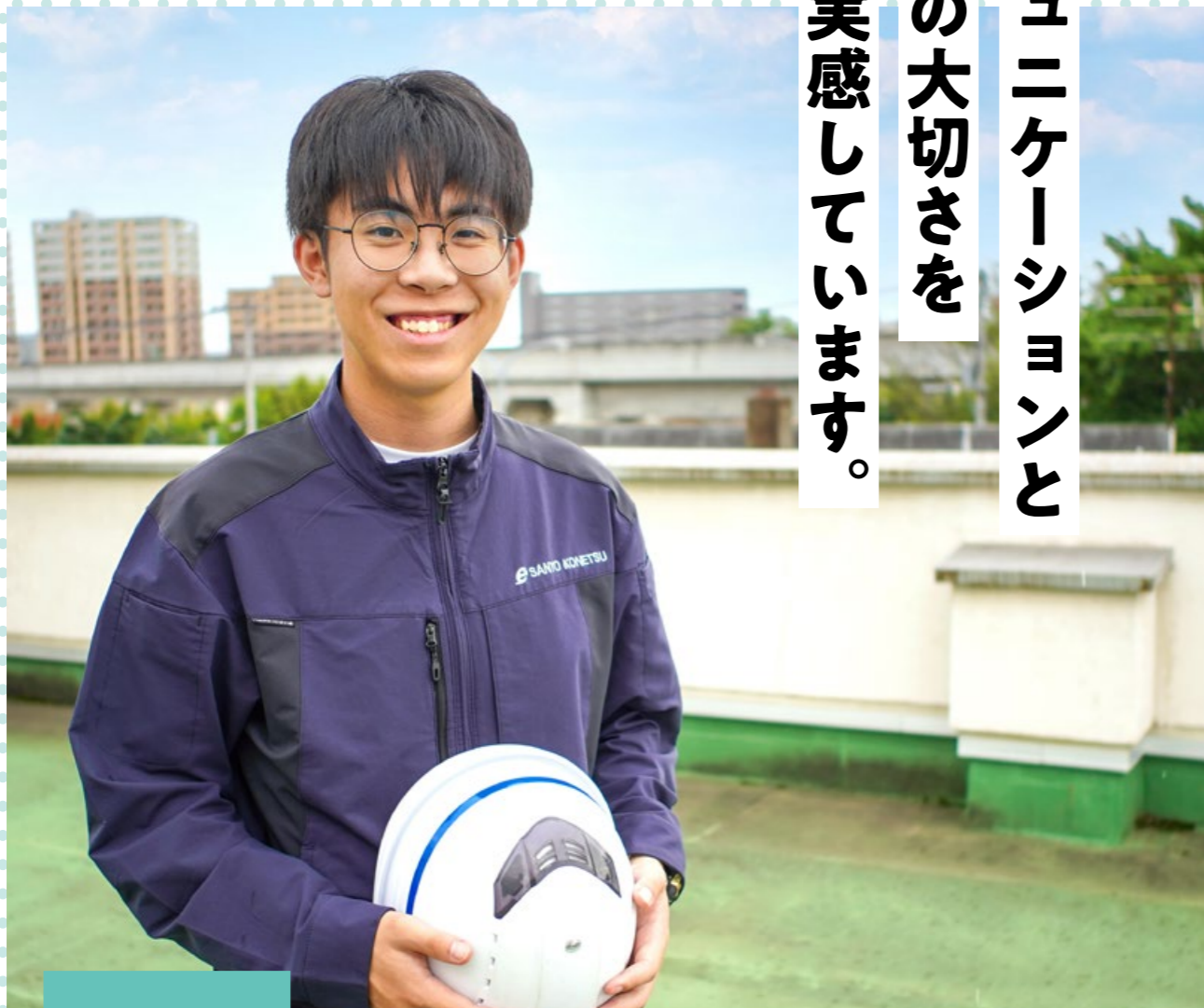
設備事業部 技術室 帯広工業高校 電子機械科卒

設備事業部の1日って大変？ 楽しい？自分でもできる？ 入社3年目の若手社員に 仕事のやりがいなどを聞きました！